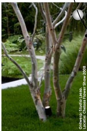
Ontwerp: Studio Lasso. Locatie: Chelsea Flower Show 2008