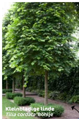
Kleinbladige linde Tilia cordata 'Böhlje'