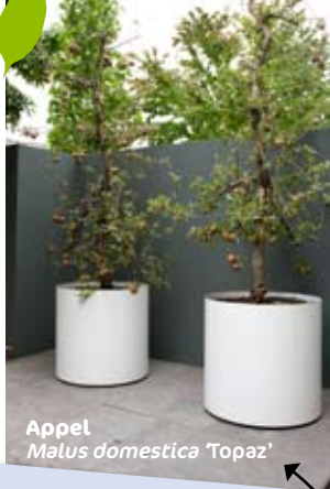
Appel Malus domestica 'Topaz'