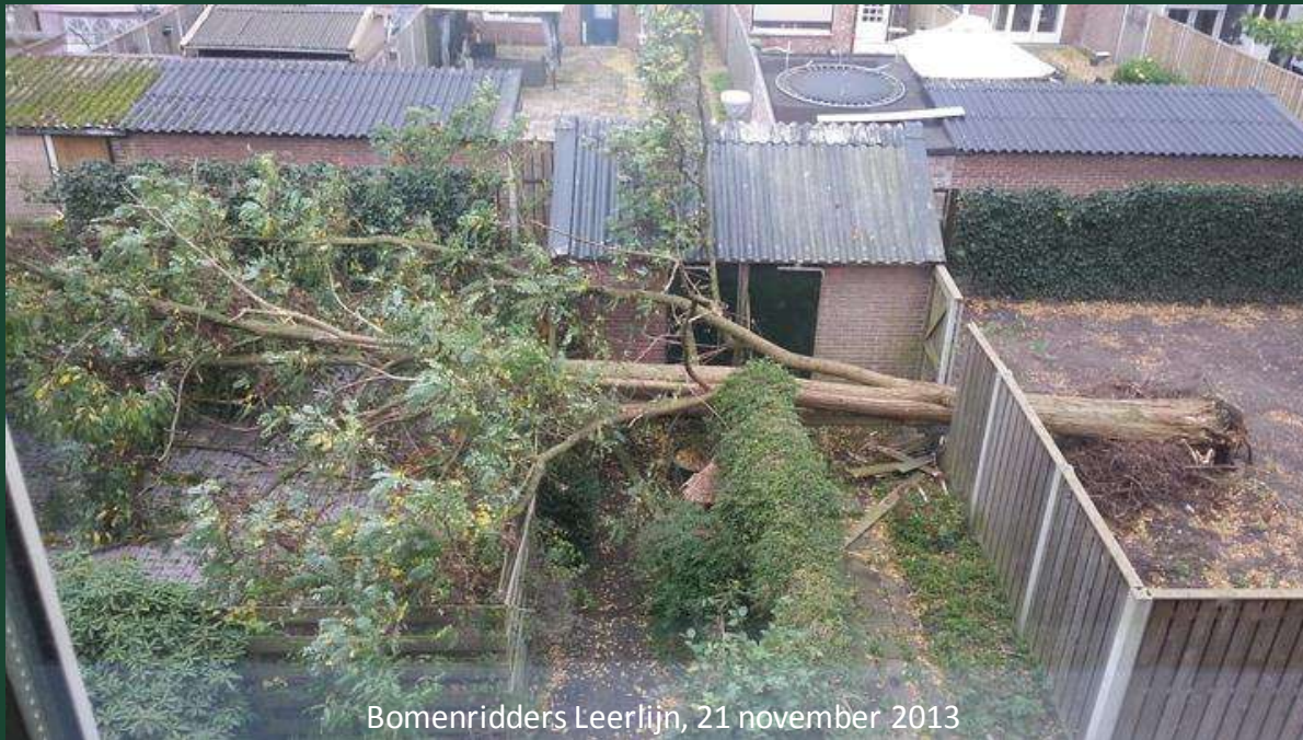
Bomenridders Leerlijn, 21 november 2013